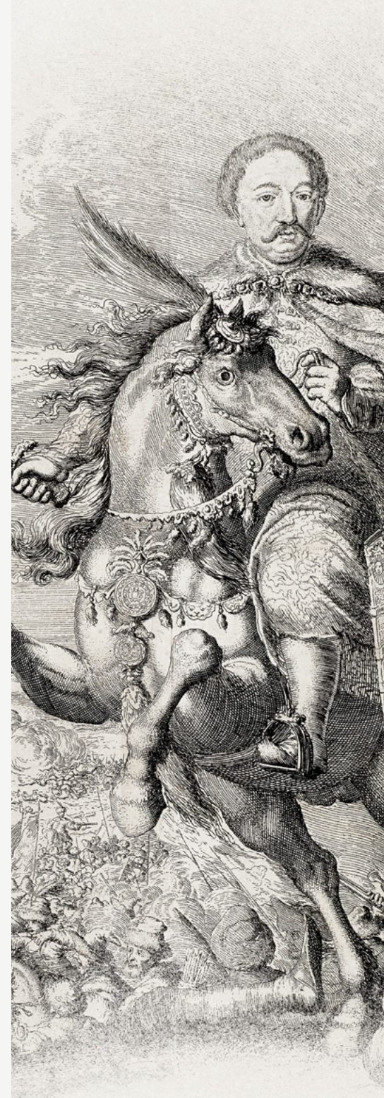
Jan Luyken, Groffflucht Jans Sobieskiego na tle bitwy chocimskiej, 1673–1683 Zamek Królewski w Warszawie – Muzeum, Kolekcja dr. Tomasz Niewodniczańskiego, dep. Deutschi-Polnische Stiftung Kulturpflege und Denkmalschutz (Gottitz), 101. Malgorzata Niewiadomska, Andrzej Ring